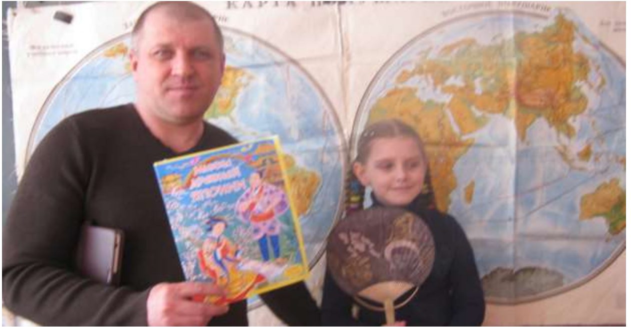
Державні символи Японії.

Вчитель ознайомила дітей з міфами древньої Японії.